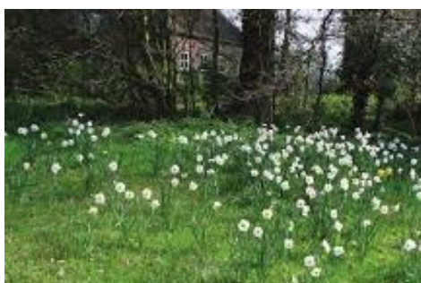
Stinzenplanten in park Goudestein