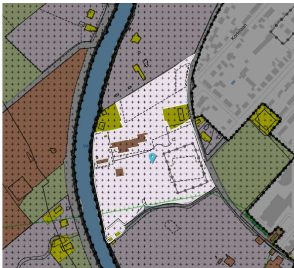
Buitenplaats Goudestein (totaal)